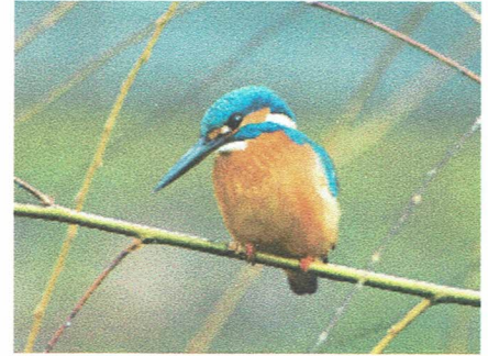
かわせみ

《ホームページ》 http://www.kumamoto-airo.com (『一般熊本西』で検索できますよ)